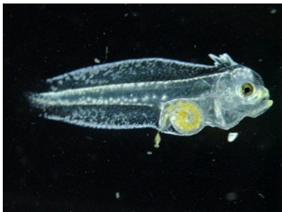
ふ化13日目のヒラメ仔魚です。 餌が消化管に入っているのが 観察できます。