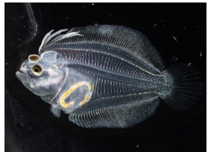
ふ化25日目のヒラメ仔魚です。 ヒラメらしい姿に成長してき ました。