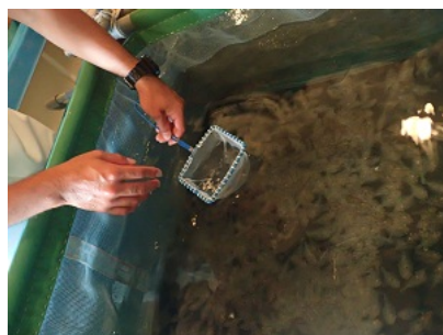
成長したヒラメ稚魚から奇形 のあるものを除き、健康な個体 だけを放流します。