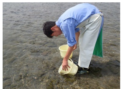
無事に成長するようお願いを込 めて放流します。