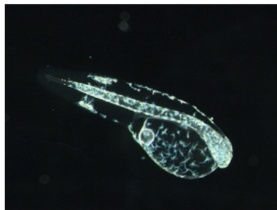
ふ化直後のヒラメ仔魚です。 眼や口ができていません。 卵黄の栄養で成長します。