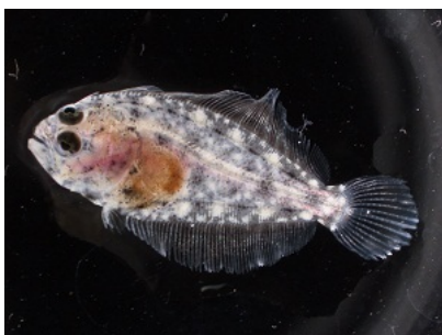
ふ化31日目のヒラメ稚魚です。 親と変わらない姿に成長しま した。