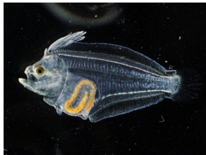
ふ化19日目のヒラメ仔魚です。 徐々に眼が左側に寄ってき ます。