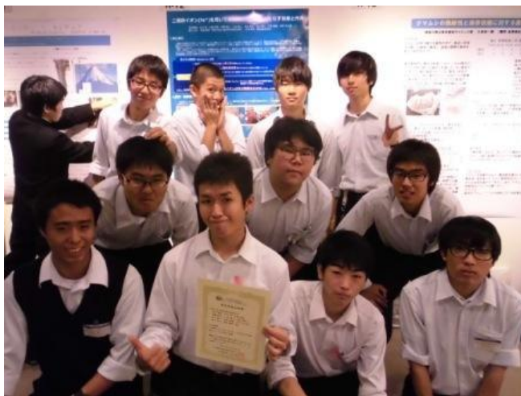
写真 2 発表終了後に集合写真。お疲れ様でした！