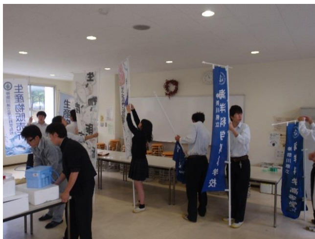
生産物販売所 会場準備