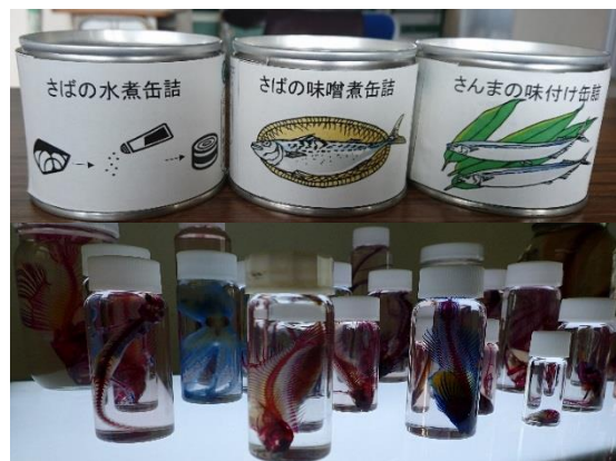
実習製作品 缶詰(上)と透明骨格標本(下)