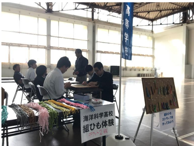
写真1：朝のブース設営の様子

当日は秋晴れで暖かく、多くの参加者でにぎわった三浦YMCA フェスティバルでしたが、おかげさまでブースにもたくさんの方が足を運んでくださいました。ご来場いただき、誠にありがとうございました。