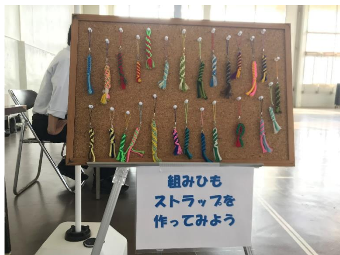
写真2：組紐ストラップ見本