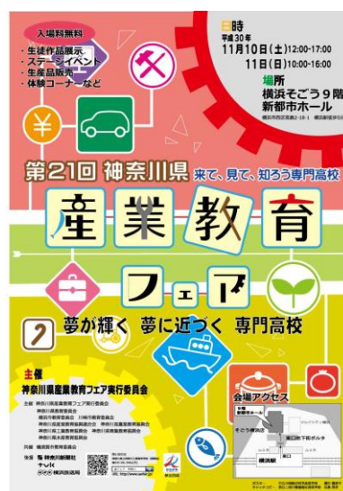
写真4：産業教育フェアにもぜひいらしてください